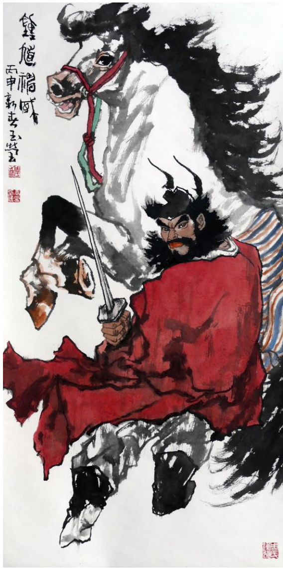
Zhou Yu Ying – “Zhong Kui Shen Wei 2”