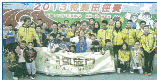
澳門凱旋門員工與幼兒運動會參賽兒童及其家長合照。

澳門凱旋門管理層表示, 是次活動不僅增強員工對特殊兒童的了解和關注, 更讓員工切身感受特殊兒童的困難及需要。凱旋門一向致力關注社會中的弱勢社群, 並鼓勵員工積極參與社區義工活動, 以實際行動關心社會的不同團體, 於幫助他人同時, 充實個人的身心發展, 為推動社會和諧及弱健共融作出貢獻。