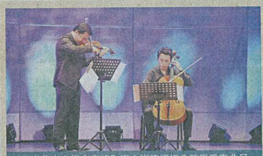
傑出華人音樂家寧峰和秦立巍演繹經典弦樂重奏曲目

莫垂道稱，由於當日的比賽地點位於路環且參與人數近三千人，將會有警員在場指揮交通，提醒家長及學生應盡量使用公共交通工具，有需要可查詢各巴士公司路線。 當日賽場設有報到處，凡集體領取畫紙的學校，須由教師持「集體領取畫紙」憑證於下午二時至二時半到「集體領取畫紙處」領取，其餘參賽學生於上述時間到各組報到處領取畫紙，自備畫紙者請出示賽會發給的號碼卡；參賽者不得接受別人提示或代筆，不得帶備相片、畫稿等相關題材作參考之用；參賽者應自備所需文具（紙除外），比賽期間不得向別人借用；參賽者須自覺遵守賽區秩序，不得超越賽區作畫和嬉戲，保持地方清潔。