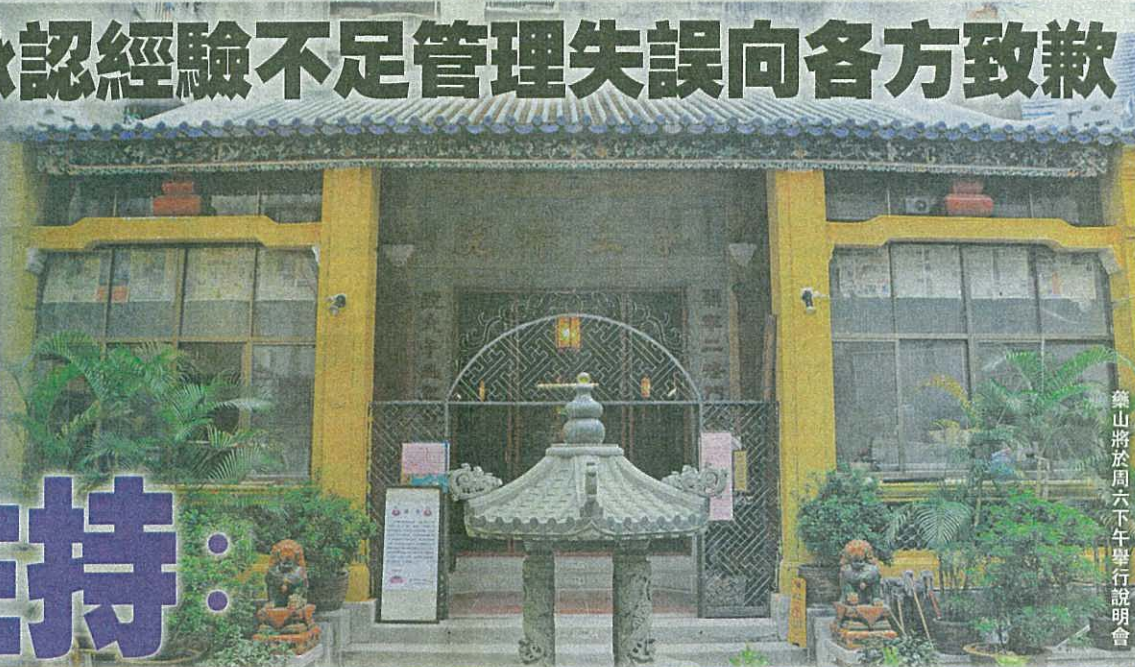
藥山將於周六下午舉行說明會