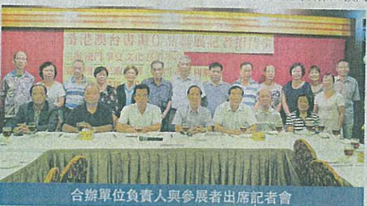
合辦單位負責人與參展者出席記者會

【本報消息】由澳門華夏文化藝術學會主辦的“番港澳台書畫展”，今日下午六時假盧園春草堂展覽廳舉行。展覽共展出逾一百件來自兩岸四地的書畫家作品，表現了相同文化在不同地域的傳承和特色，為各地書畫家提供相互交流的平台，使友誼在墨寶間昇華，增強中華民族的凝聚力。