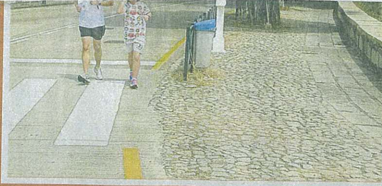
天朗氣清，父女倆架着墨鏡，慢跑西灣堤岸，好不寫意。